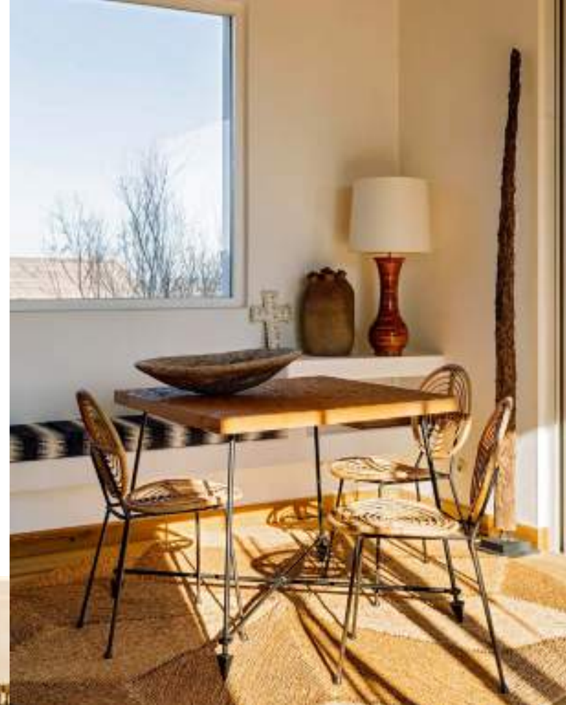
Mesa de Barracuda Edition , sillas de ratán de los 50, alfombra lusa, lámpara italiana, vasija de terracota de Mali. Dcha., la casa, obra del arquitecto Miguel Cândia Martins. Debajo, izda., en un dormitorio,