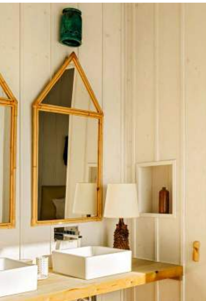
Uno de los baños con espejo diseñado por Neimann, lámpara zoomórfica de los 50 y aplique de los 70, ambos franceses. Dcha., en un dormitorio, mesa de madera y ratán francesa de los 50 con silla de Hänninen y lámpara de