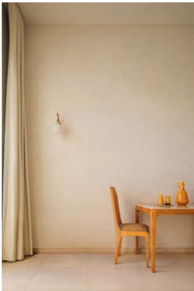
Konst från ett galleri till hotellet där man på nära håll får leva med verken.