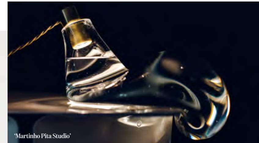
‘Martinho Pita Studio’